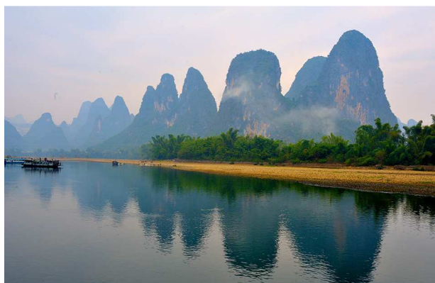
Five Fingers Hill su Li River

I suoi filmati più recenti: Primavera in Western Australia - Taranto la città dei misteri - Bhutan il regno del dragone - Australia ai tropici, Top End & Kimberley - Namibia diamante d'Africa - Us Pacific coast - British Columbia, la finestra sul Pacifico - Cina fra passato e futuro - Sabai-dj Laos - Laos, plenilunio a Muang Sing - Laos, tesori del sud - Laos, terra violata - Bonjour Québec - Maritimes, il Canada incontra l'Atlantico-Usa, il volto del Sud - Profondo Nord, viaggio in Scandinavia.